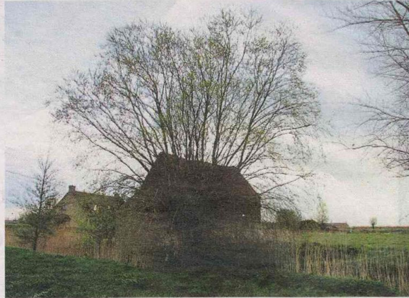
Huismussenwerkgroep Koksijde springt al voor de derde keer in de bres om knotwilgen te redden.

VEURNE ◊ Op vrijdagvoormiddag 6 mei vindt aan de Bruggesteenweg in Veurne een grote reddingsactie plaats voor elf knotwilgen die al meer dan 70 jaar oud zijn. Het initiatief komt van de Huismussenwerkgroep Koksijde.