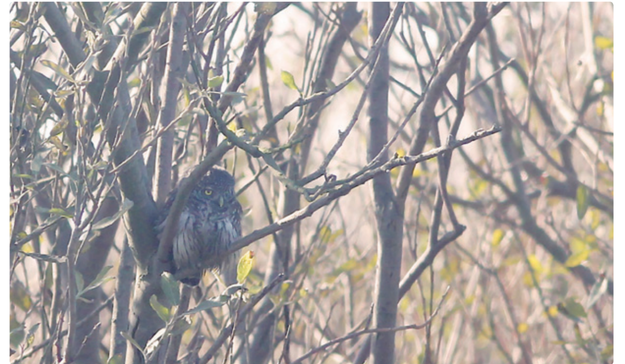
Dwerguil, Texel, 14 oktober 2011

De waarneming van Texel betreft daarmee het zesde geval voor Nederland. Dit geval moet echter