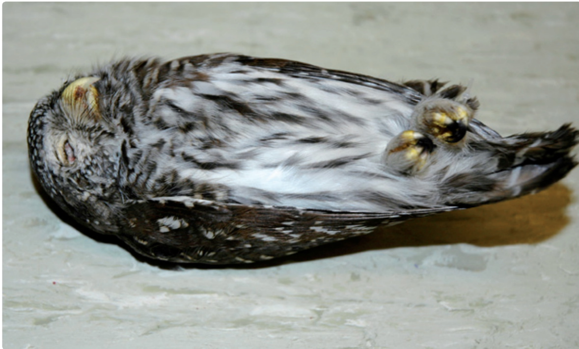
Dwerguil, Lauwersmeer, verkeersslachtoffer 18 oktober 2008