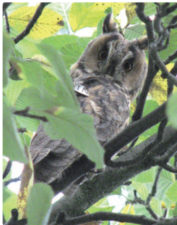
Figuur 12. Vrouwje TN (3kj) op de zomerslaapplaats met 'bigamie-achtige' verschijnselen.

De redenen voor Ransuilen om na de winter op de slaapplaats te blijven of er snel naar terug te keren, kunnen dus heel divers zijn. Sommige uilen zijn niet gepaard, andere broeden niet succesvol of zijn blijkbaar nog te jong om aan het voortplantingsproces deel te nemen. Ook een verminderde conditie zal Ransuilen misschien doen besluiten om maar op de slaapplaats te blijven. Een niet afgemaakte rui