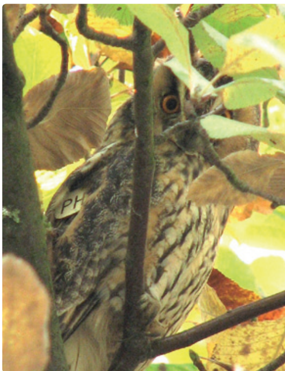
Figuur 11. Mannetje PH (5kj) sluit zich aan bij de zomerslaapplaats door niet succesvol broedseizoen.

terwijl de jongen zich nog bedelend in de tuin van de boerderij bevonden. TN werd blijkbaar als een bekend 'overschot-vrouwje' gedoogd in het territorium van het broedpaar ter plaatse. Helaas is niet bekend of TN zelf in dit territorium geboren is en als jong uit een eerder broedseizoen geaccepteerd werd door haar eigen ouders. Dat TN een plaatselijk nestjong is ligt voor de hand, want ze is in augustus 2007 als eerstejaars vogel (met nog pluus op de kop) gevangen in een klepkooi in de buurt. In 2010 werd TN als vierdejaars wel met zekerheid succesvol broedend aangetroffen op nota bene dezelfde boerderij. Uit aflezingen van andere relatief jonge uilen is bekend dat ze jarenlang in de buurt van het ouderlijke territorium blijven. Mogelijk deed TN ervaring op en nam zij een jaar later het territorium over toen er een plaats als broedvogel beschikbaar kwam.