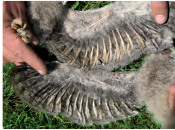
Figuur 4. Ondervleugel nestjongen bruin bij vrouw (boven) en wit bij man (beneden).

In muizenrijke jaren hebben Ransuilen vaak grote nesten met wel 4-5 jongen (in Servië zelfs 6-7). In dit soort jaren is de geslachtsverhouding tussen de nestjongen ongeveer gelijk. Op een leeftijd van 2-3 weken is op de ondervleugel aan de hand van de kleur van de armpennen (die uit de bloedspool steken) het geslacht te bepalen (figuur 4). Hierbij kan het hogere gewicht van vrouwtjes als extra determinatiekenmerk worden gebruikt. Ook de