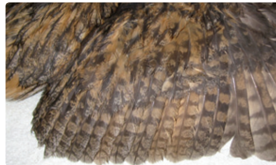
Figuur 8. Derde kalenderjaar (3kj) met combinatie van oude armpennen met 6 banden en nieuwe armpennen met 4 (of 5) banden.

Uit terugvangsten van geringde nestjongen en aflezingen van hun ouders blijkt dat slaappleaatsen bestaan uit een vaste kern van bekende vogels. Uit vangsten van ongeringde jonge en aflezingen van oude uilen waarvan een familieband niet duidelijk is vastgesteld blijkt dat ook zij meestal tot die vaste kern behoren. Overigens worden op slaappleaatsen