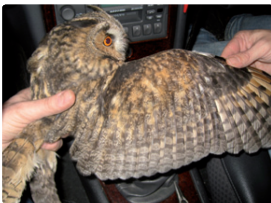
Figuur 7. Na tweede kalenderjaar (>2kj) met 4 banden.

Een >3kj vogel heeft zijn rui in het najaar ook niet afgemaakt. Deze vogels hebben wel al een keer eerder geruid en beschikken nu over een combinatie van zowel oude, gesleten en lichtgekleurde als nieuwe, donker gekleurde armpennen met 4 (of 5) banden (figuur 9). De algemene trend is dus dat jonge Ransuilen in hun jeugdkleed armpennen hebben met 6 banden die na de eerste rui worden vervangen door armpennen die twee banden minder hebben.