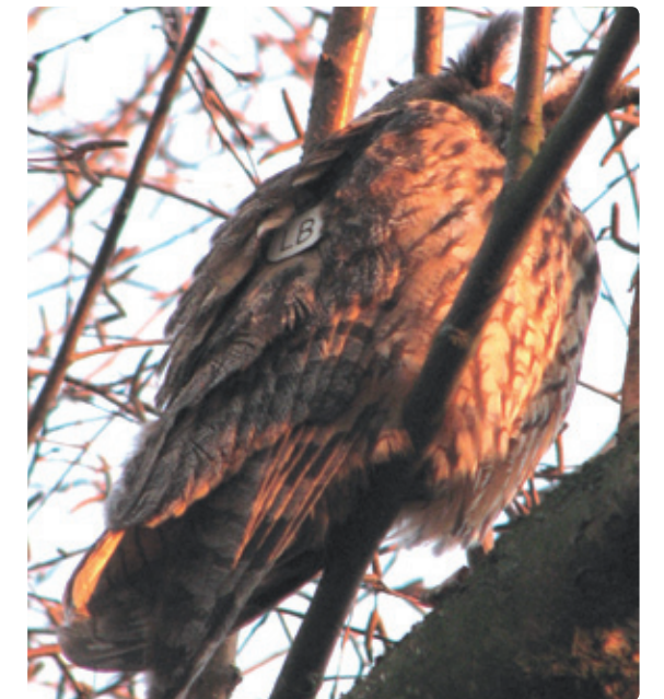
Figuur 10. Vrouwtje LB (>5kj) ongepaard op de zomerslaappleaats sinds 2007.

Van de 13 gemerkte Ransuilen bleken er 6 tweedejaars te zijn. De helft van deze uilen zat ook een daaropvolgend jaar de hele zomer weer op de slaappleaats. Opmerkelijk is dat van de vele tientallen Ransuilen die tot op heden broedend zijn waargenomen de leeftijd minstens >2kj is. Het lijkt er sterk op dat Ransuilen in tegenstelling tot andere uilensoorten in hun tweede en mogelijk zelfs derde kalenderjaar niet of nauwelijks tot broeden komen. Dit is in tegenspraak met de literatuur waar melding wordt gemaakt van broeden op een leeftijd van één jaar (Cramp 1988). In dit verband is de levensloop van Ransuil TN illustratief (figuur 12). Dit derdejaars vrouwtje leek in 2009 op een afstand van 1,5 km van de zomerslaappleaats tot broeden te zijn gekomen. Ze werd in de voortuin van een boerderij afgelezen met enkele takkelingen bij haar in de buurt. In de loop van juni werd zij echter al weer dagelijks afgelezen op de zomerslaappleaats,