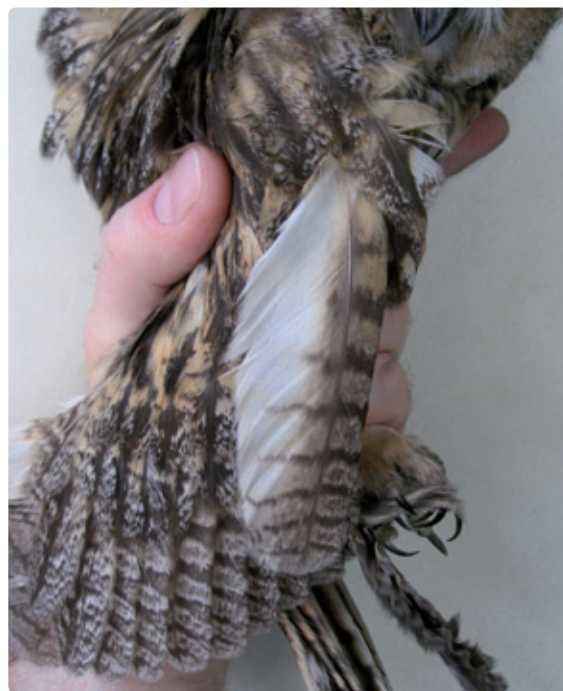
Figuur 2. Binnenvlag armpennen bruin bij vrouw (links) en wit bij man (rechts).

gebied zijn gevangen in de zomermaanden. In de periode 2004-2010 zijn in de maanden juli t/m september in het open veld 126 Ransuilen gevangen met behulp van klepkooien. Van deze groep bleek 55% een mannetje te zijn, wat significant afwijkt van het langjarige gemiddelde: in verschillende jaren is waargenomen dat in het begin van de zomerperiode in eerste instantie meer mannetjes worden gevangen en pas later in het seizoen meer vrouwtjes. Waarschijnlijk is in juli de vangkans voor mannetjes relatief groot omdat zij dan nog jagen voor hun jongen. De vrouwtjes blijven in die periode meer in de buurt van het territorium ter bescherming van de jongen; dat leidt juist tot een relatief lage vangkans. Als later in het seizoen de eerste jongen worden gevangen neemt de vangkans voor vrouwtjes ook toe. Ter vergelijking zijn in dezelfde periode 2004-2010 ook 137 Ransuilen gevangen op winterslaapplaatsen. Van deze groep bleek slechts 39% een mannetje te zijn. Welke verklaring is er nu te geven voor het vrouwenoverschot op de winterslaapplaatsen? Hieronder worden 3 hypothesen besproken.