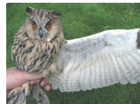
Figuur 1. Ondervleugeldekveren bruin bij vrouw (boven) en wit bij man (beneden).