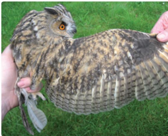
Figuur 6. Tweede kalenderjaar (2kj) met 6 banden.

Jonge Ransuilen gaan in hun tweede levensjaar rond juli in de rui en beëindigen die zo rond september/oktober. Sommige individuen maken de rui niet af en laten enkele oude armpennen met 6 banden nog een jaar zitten. Deze 3kj vogels hebben dan een combinatie van oude gesleten lichtgekleurde armpennen met 6 banden en nieuwe donker gekleurde armpennen met 4 (of 5) banden (figuur 8).