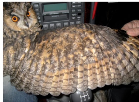
Figuur 9. Na derde kalenderjaar (>3kj) met een combinatie van oude en nieuwe armpennen met 4 banden.

ook regelmatig nieuwe individuen aangetroffen die in een kwart van de gevallen te herleiden zijn naar nestjongen afkomstig van een naburige groep. Een aantal keren is vastgesteld dat uilen die behoren tot een bepaalde groep, kort na de schemering gericht gaan 'buurten' op slaappleaatsen in de omgeving. Hieruit blijkt dat er niet alleen een sociale band is tussen de individuen binnen een slaappleaats, maar ook tussen slaappleaatsen onderling.