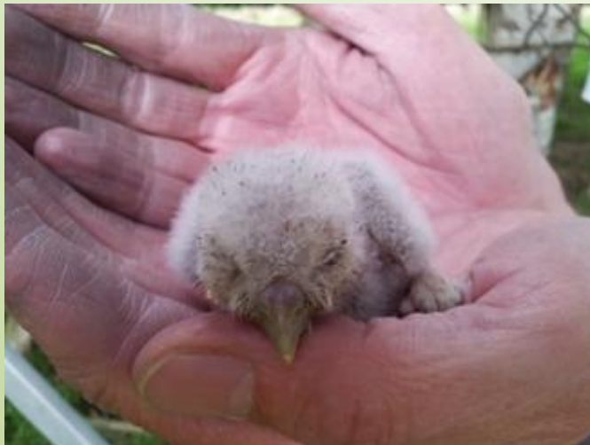
Haaren: Jong van een paar dagen oud.