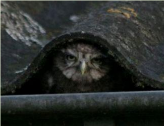
Haaren: Oplettende buurman ontdekt broedgeval onder de golfplaten!

Oisterwijk: Helaas vielen er ook slachtoffers. Deze jongen uilen hebben het door onderkoeling (door inregenen in de kast) niet gered.