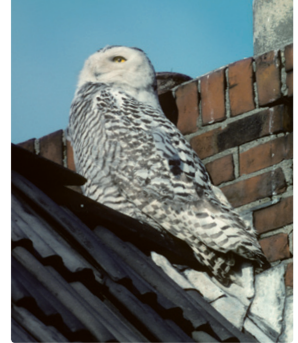
1e winter vrouw, 30 december 1980-10 januari & 7 februari 1981, Leeuwarden

Bij het schrijven van dit stuk waren Peter Barthel, Arnoud van den Berg, Max Berlijn (archivaris CDNA), Willem-Jan Fontijn, Marnix Jonker, René Pop, Seraf van Putten en Troels Eske Ortvad zeer behulpzaam. Bedankt!