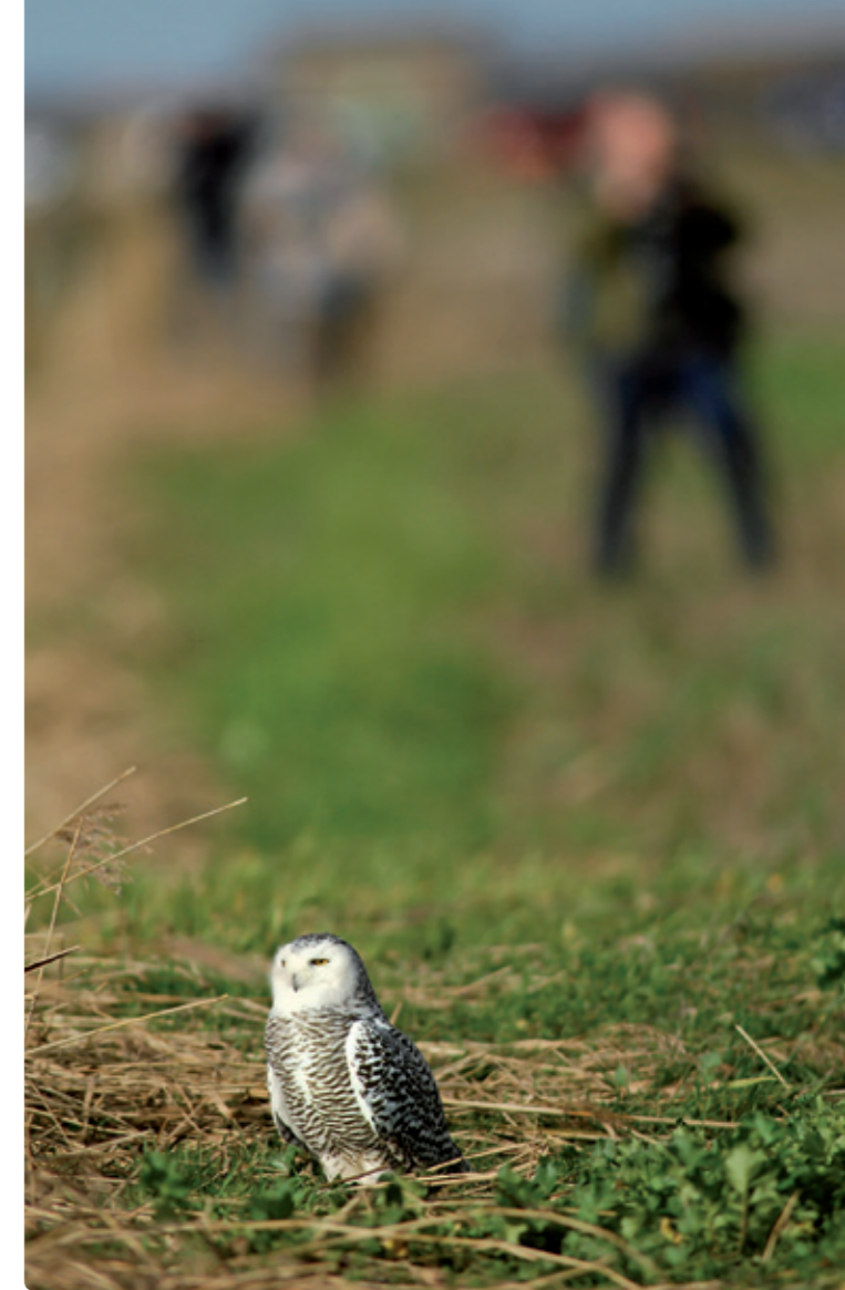
De Texelse vogel, 17 november 2008.

Bij onze zuiderburen in België is de soort aanmerkelijk zeldzamer dan in Nederland. Tot en met 2010 zijn er vier gevallen aanvaard, waarvan twee