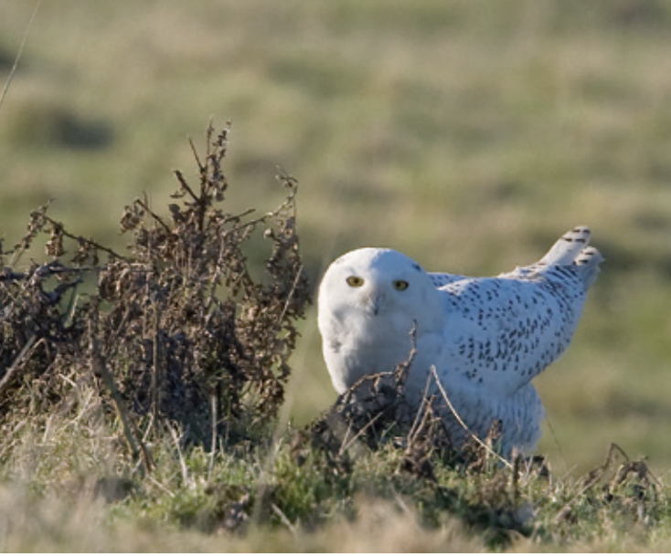
Ten tijde van de Texelse Sneeuwuil (zie foto blz 69) werd de Uitkerkse Polder, nabij Blankenberge, West-Vlaanderen, bezocht door dit jonge mannetje.

in de noordelijke kuststreek (vooral in Bretagne), maar ook enkele gevallen in het binnenland langs de grens met België (Dubois et al. 2008). Het optreden van de soort in Groot-Brittannië ten slotte heeft nog het meest regelmatige karakter van Noordwest-Europa. Tot 1950 zijn er 177 waarnemingen bekend geworden en sindsdien nog eens 181 (Slack 2009). Vanaf de jaren '60 van de vorige eeuw (toen gedurende 1967-'75 meerdere broedgevallen plaatsvonden op de Shetland Eilanden) worden nagenoeg jaarlijks Sneeuwuielen waargenomen, vooral langs de Schotse kusten en dan met name de Shetland Eilanden en de Hebriden. Hoeveel Sneeuwuielen er in Schotland rondvliegen, is moeilijk in te schatten. Het vermoeden bestaat dat verschillende vogels over een groot gebied rondzwerven en hierbij vaak verschillende eilanden aandoen. In Engeland is de soort daarentegen nog een echte zeldzaamheid met 19 aanvaarde gevallen sinds 1950. Invasiejaren op het vasteland van Europa lijken vooral synchroon te lopen met waarnemingen in Engeland, terwijl de gevallen in Schotland hun eigen dynamiek lijken te hebben. Dat laatste blijkt ook uit het feit dat in Schotland in alle maanden Sneeuwuielen zijn waargenomen, terwijl in Engeland de gevallen zijn verdeeld over de periode september-maart (Slack 2009).