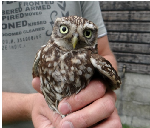
Rechts als jong volwassen broedend vrouwtje (juni 2013)