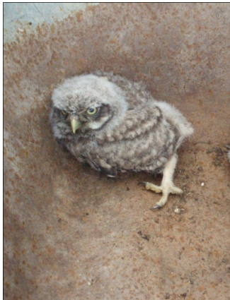
Links: als steenuilskuiken (juni 2012)

in 2010 in Streefkerk geringd vrouwtje is. Waar de vader van het gezin vandaan komt, is onduidelijk. Hij heeft een ringloze jeugd gehad. Pa maakt zichzelf bij de nestkastcontroles bovendien altijd snel uit de voeten/veren. Ze doen het niet onverdienstelijk want het stel heeft inmiddels al 10 jonge uilskuikens met succes laten uitvliegen. In 2012 en 2013 zijn zelfs al 2 vrouwelijke nakomelingen van dit stel in respectievelijk Schipluiden en Zwammerdam terug gemeld. Zij waren daar inmiddels zelf ook succesvol tot broeden gekomen. Een teken dat de populatie uit het Reeuwijkse ook de populatie in andere delen van de provincie van vers bloed voorziet.