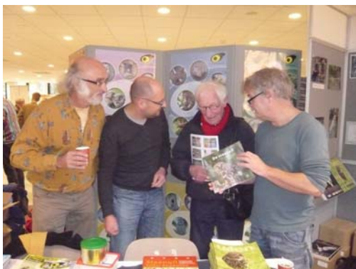
Jaarverslag 2011 Stichting STONE

Traditiegetrouw was STONE op 26 november met een stand aanwezig op de SOVON-dag in Nijmegen. De stand werd druk bezocht. De tentoongestelde anti-marternestkast van kastenbouwer en steenuilenman Bert Kwakkel leverde geanimeerde gesprekken op met bezoekers.