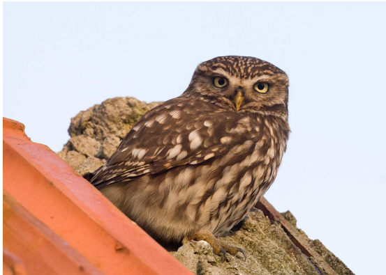
Een karakteristieke pose

De Steenuil is de kleinste in ons land voorkomende uil. Met zijn lichaamslengte van 21 cm is hij maar net iets groter dan een merel. Het is een minder uitgesproken nachtvogel dan andere uilen. Daarom zie je ze ook nog wel eens overdag. Ze zitten dan vaak op het dak van een schuurtje, in de luwte en bij voorkeur in de zon. Steenuilen zijn bijzonder trouw aan een eenmaal gekozen territorium en ook paartjes blijven in principe levenslang bij elkaar. Het zijn echte holenbroeders. Nesten worden aangetroffen in holtes in knotwilgen, appelbomen en onder daken van schuurtjes. Ook broeden ze graag in nestkasten. In april worden gemiddeld 4 eieren gelegd. In de loop van juni verlaten de jonge uilen de broedplaats. Ze blijven daarna nog enige tijd in het ouderlijk territorium. In het najaar gaan ze dan op zoek naar een eigen gebied. Het voedsel bestaat uit insecten (kevers, larven, rupsen), muizen, regenwormen, kikkers en vogels.