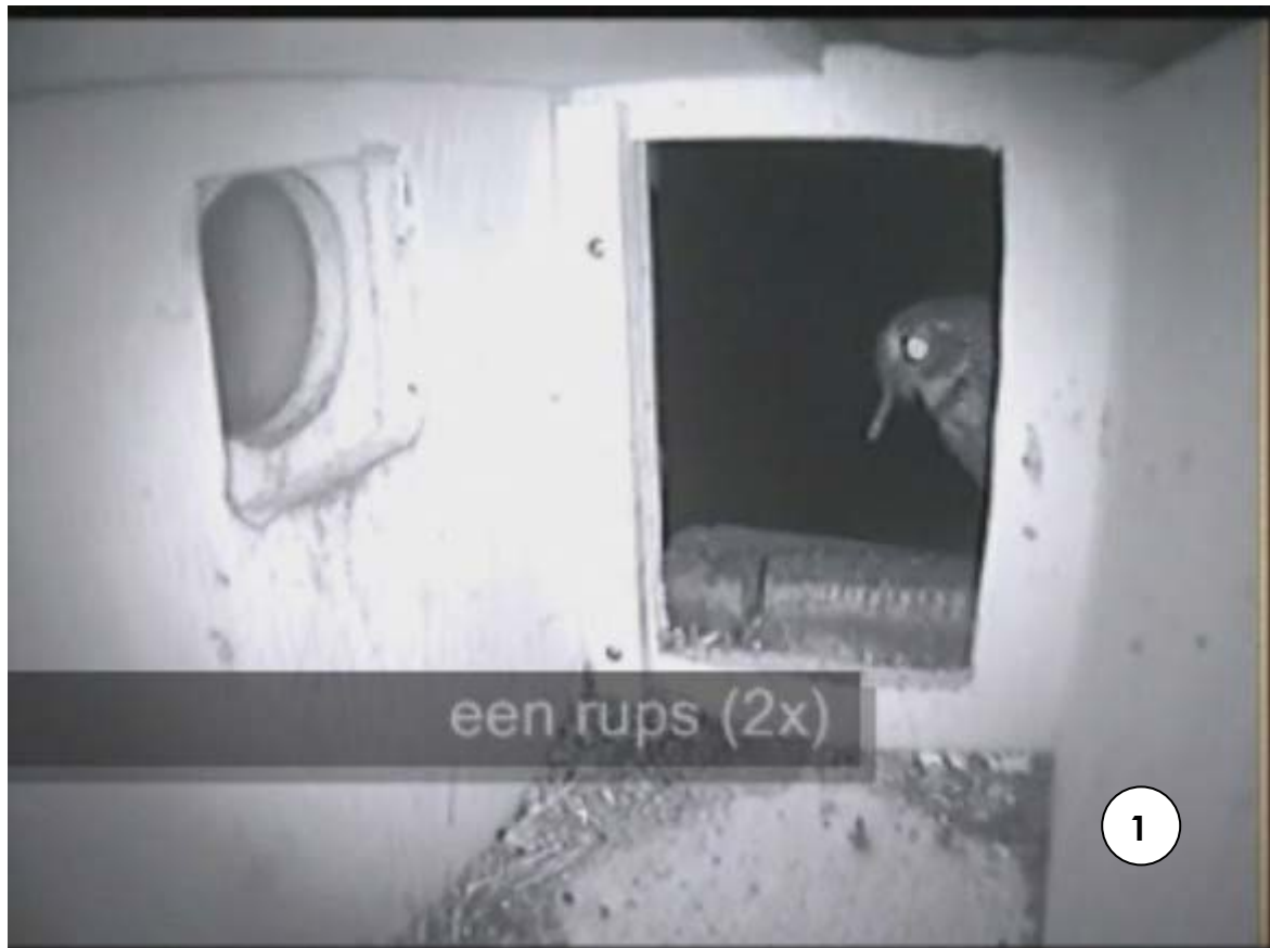
Kleine rups/larve (boven, grote rups/larve (volgende pagina)

Een larve die wel goed van een rups te onderscheiden is de Rattenstaartlarve (afbeelding 3). De larve lijkt een staart (zie pijl) te hebben (in werkelijkheid een ademhalingsbuis) die zorgt voor een duidelijk onderscheid.