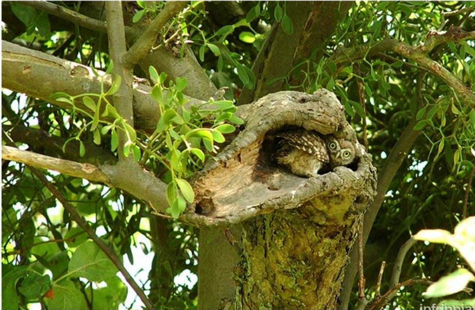
Foto 5. Steenuil in natuurlijke holte in es