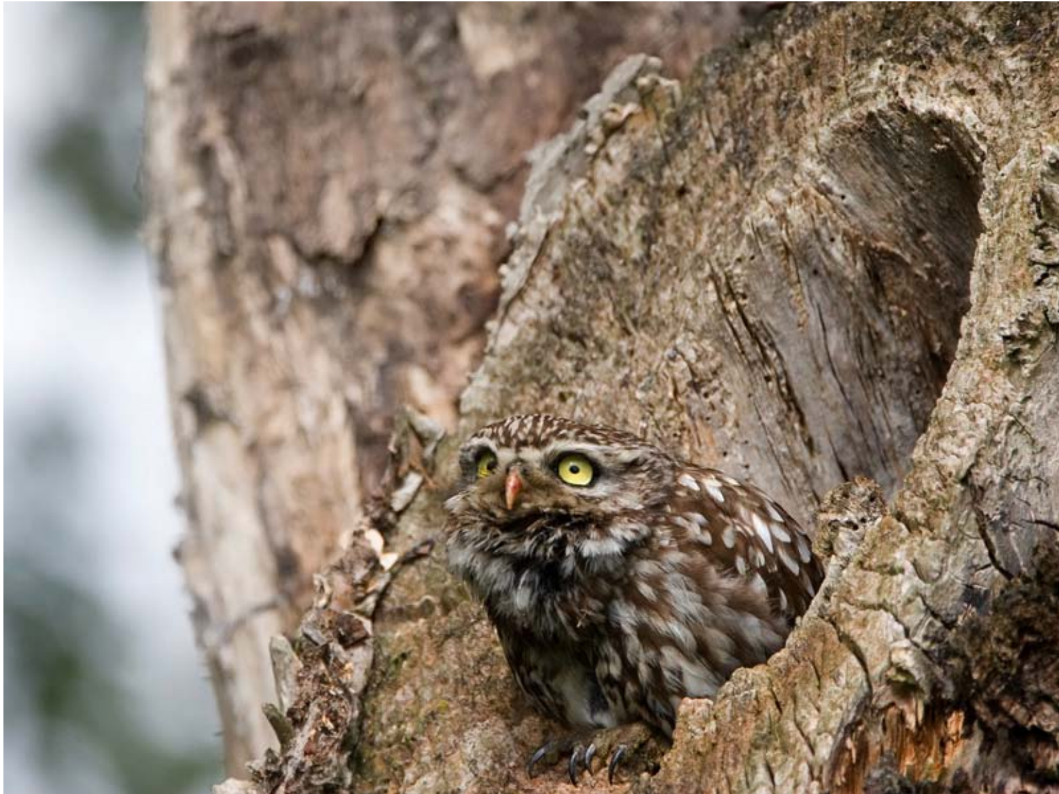
Foto 4, Steenuil in natuurlijke holte in oude boom