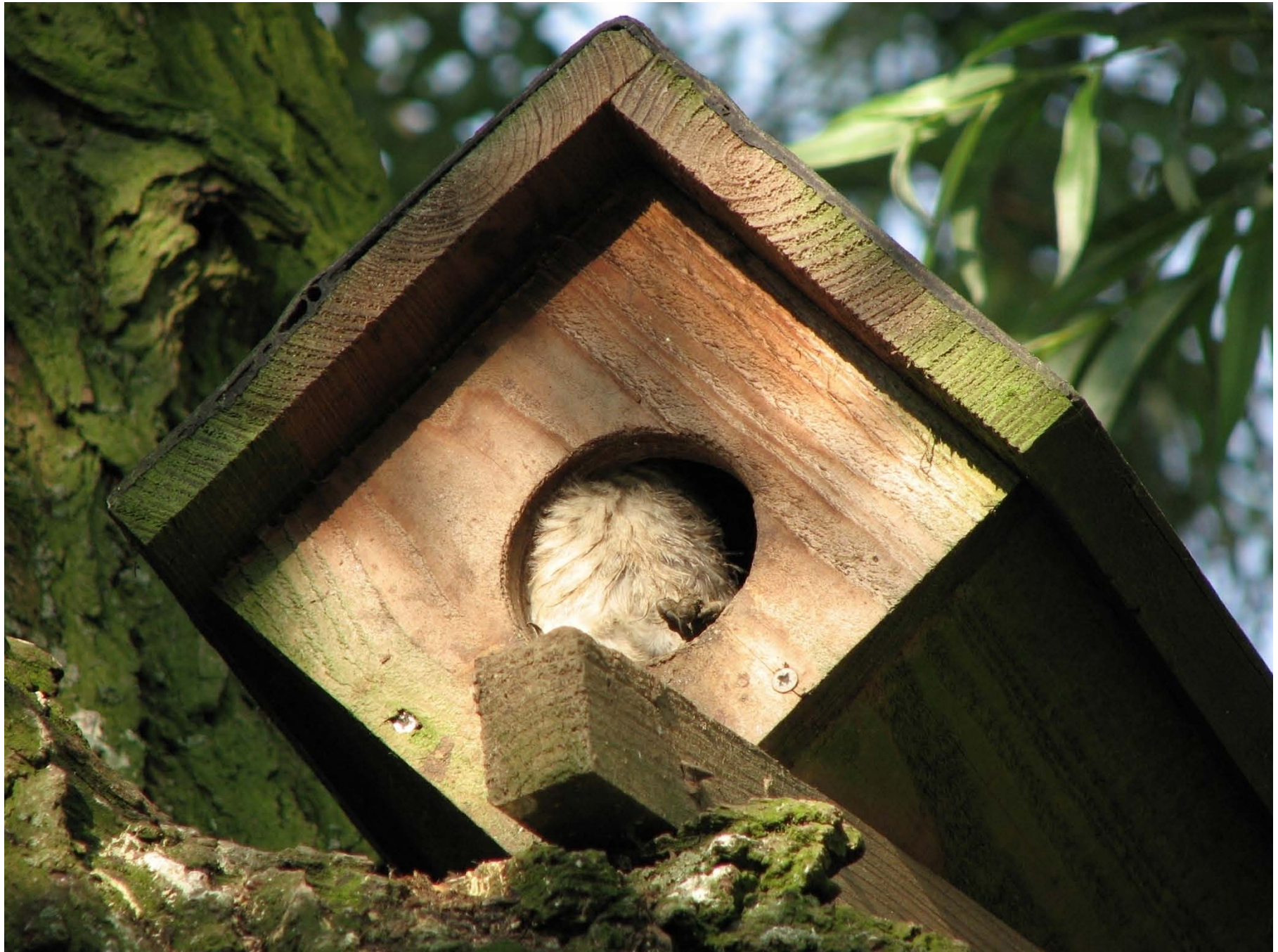
Foto 6. Jonge steenuilen bij de familie Paardekooper in Randwijk