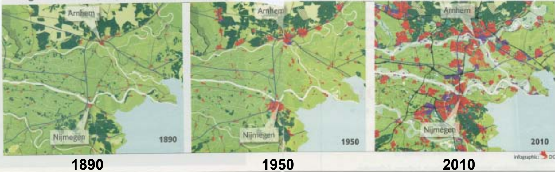
Kaart 1 Verstedelijking in het oostelijk rivierengebied 1890 - 2010